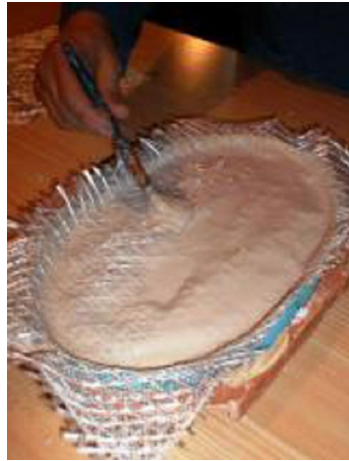
Laminavimas (armuojant naudoti šarmui atsparias medžiagas)